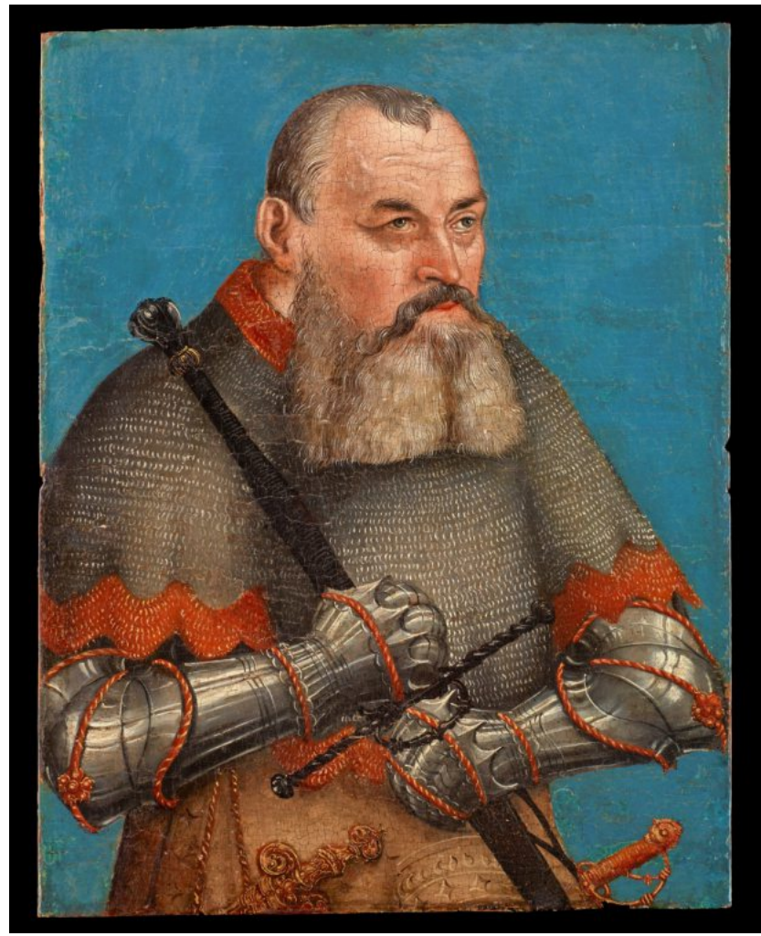
580.000 Euro bei Senger: Lucas Cranach der Ältere und Werkstatt, „Herzog Heinrich der Fromme“, um 1534, Öl auf Holz, 20 mal 15 Zentimeter

Franke nimmt nicht an der TEFAF teil; er setzt auf kleinere Messen und das