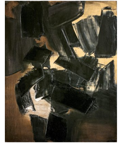
Als Gegenwartsmaler an der Spitze: Pierres Soulaiges' „Peinture 12 août 1959“ stieg bei Artcurial auf über zwei Millionen Euro.

Das größte französische Auktionshaus Artcurial feiert in diesem Jahr sein zwanzigjähriges Bestehen und meldet einen Rekordumsatz von 155 Millionen Euro im ersten Semester. Der 102 Jahre alte Pierre Soulaiges ist der teuerste französische Gegenwartsmaler. Sein Frühwerk erreicht besonders hohe Zuschläge. Deshalb erstaunt es, dass die „Peinture 92 x 73 cm, 12 août 1959“ aus der Sammlung Schwarz-Sterngold mit 2,06 Millionen Euro die untere Taxe nicht überflügelte (2,3/3,3 Millionen Euro). Artcurial hatte mit einem Stillleben