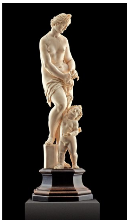
36.600 Euro bei Franke: Adam Lenckhardt zugeschrieben, „Venus und Cupido“, 17. Jahrhundert, Elfenbein, Höhe 31,5 Zentimeter

Stets auf Nachschubsuche dürften die Bamberger Händler auch das Kunstauktionshaus Schlosser frequentieren, des-