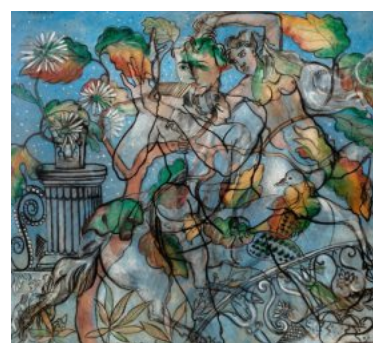
Toplos: Francis Picabia, „Pavonia“, 1929, Taxe 6 bis 8 Millionen Euro

Von Hans Arp ist das großformatige Holzrelief „L'O et l'U de l'Oiseau“ mit einer Taxe von 3 bis 5 Millionen Euro ver-