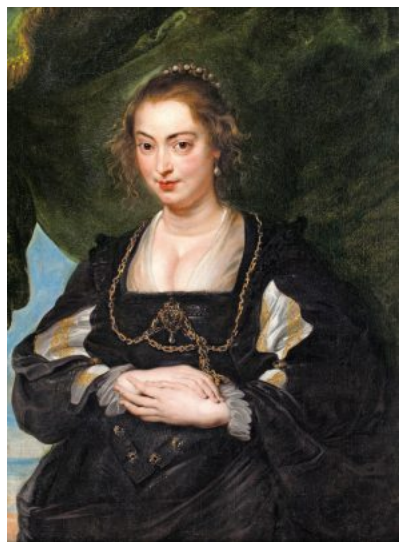
Ziert Polens Kunstmarkt: Peter Paul Rubens, „Porträt einer Dame“, um 1625, Öl auf Leinwand, 98 mal 73,8 Zentimeter, Taxe umgerechnet 3,8 bis 5,1 Millionen Euro

Zuletzt öffentlich zu sehen war das Gemälde 1965 in Brüssel in einer Ausstellung der Musées Royaux des Beaux-Arts, auch dort als „Portrait d'Isabelle Brandt“ ausgewiesen. Die Taxe in Warschau beträgt nun 18 bis 24 Millionen Zloty, umgerechnet 3,8 bis 5,1 Millionen Euro. Weitere Lose der März-Auktion bei DESA Unicum sind Werke des italienischen Malers Giovanni Battista Lampi sowie Gemälde polnischer Meister des 19. und 20. Jahrhunderts, darunter Jacek Malczewski, Leon Wyczolkowski und Aleksander Gierymski. URSULA SCHEER