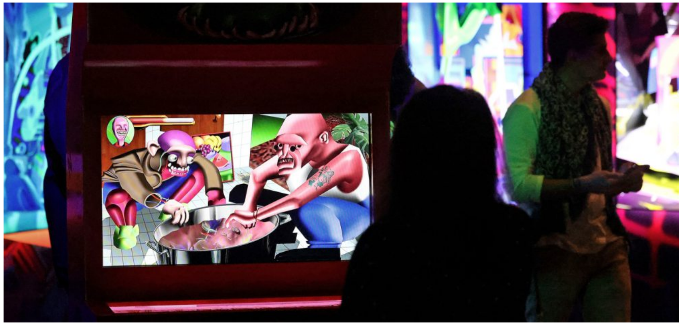
Wie eine Material gewordene Version des Darknet: NFT-Installationen füllen eine ganze Sektion der Messe.

Der Bundesverband Deutscher Galerien und Kunsthändler (BVDG) ruft zu Spenden auf: „Der Krieg gegen die Ukraine, der schwer gerüstete Überfall Putins auf einen souveränen Staat, ist zutiefst abscheulich“, heißt es auf der Website des rund 340 Mitglieder zählenden Verbands. „Wir verurteilen den Krieg auf das Schärfste. Unsere Solidarität gilt den Menschen in der Ukraine.“ Als Adressaten für Spenden werden das Flüchtlingshilfswerk der Vereinten Nationen, das Aktionsbündnis Katastrophenschutz, die Caritas und die Malteser empfohlen und auf der Homepage des BVDG verlinkt. F.A.Z.