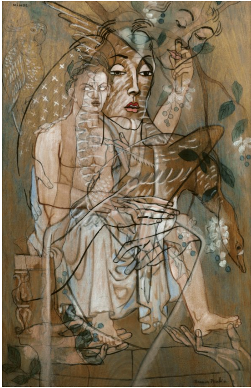
Bei der Sotheby's-Auktion „Modernités“ erzielte Francis Picabias monumentales Gemälde „Minos“ 3,3 Millionen Euro.