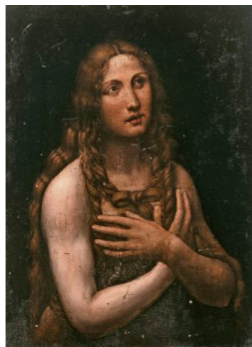
Spitzenlose: Zwei Bände der chinesischen Enzyklopädie „Yongle Dadian“ erreichten bei Beussant Lefèvre 6,4 Millionen Euro und die „Büßende Magdalena“ von Salaj bei Artcurial 1,4 Millionen Euro.

Das französische Auktionshaus Artcurial schloss mit 149,2 Millionen Euro Umsatz und einem Rückgang um 26 Prozent ab. Im Gegensatz zu den globalen Häusern vermittelt Artcurial nur in geringem Umfang private Geschäfte und blieb bis zum Ausbruch der Covid-Krise auch im digitalen Bereich zurückhaltend. Das den Umständen entsprechend zufriedenstellende Ergebnis konnte nicht zuletzt