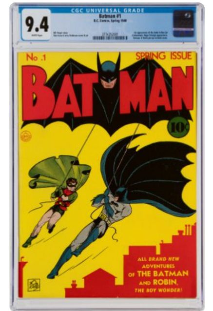
Die besterhaltene Erstaussgabe der „Batman“-Heftserie, erschienen 1940, nun verkauft für 2,22 Millionen Dollar

Comic-Originalzeichnungen dagegen sind Unikate, aber auch bei ihnen spielt Erhaltung eine wichtige Rolle. Deshalb war man gespannt, ob das über Jahrzehnte hinweg gefaltet aufbewahrte und durch diese Knick in seiner optischen Wirkung beeinträchtigte Hergé-Titelblatt tatsächlich die hohen Erwartungen erfüllen würde. Es gelang ihm knapp: Zuschlagen wurde es nach ebenfalls recht kurzem Gefecht bei 2,6 Millionen Euro; inklusive Aufgeld kos-