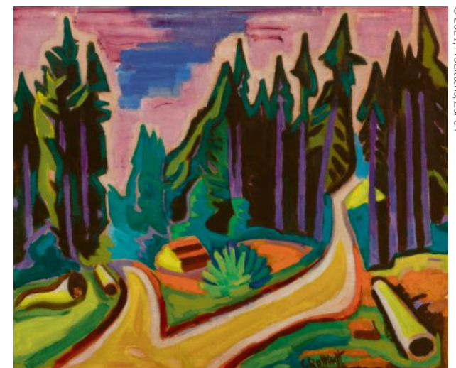
Karl Schmidt-Rottluff. Spessarttannen. 1950. Ergebnis: € 416 000

Für unsere kommende Auktion nehmen wir Einlieferungen gerne entgegen.