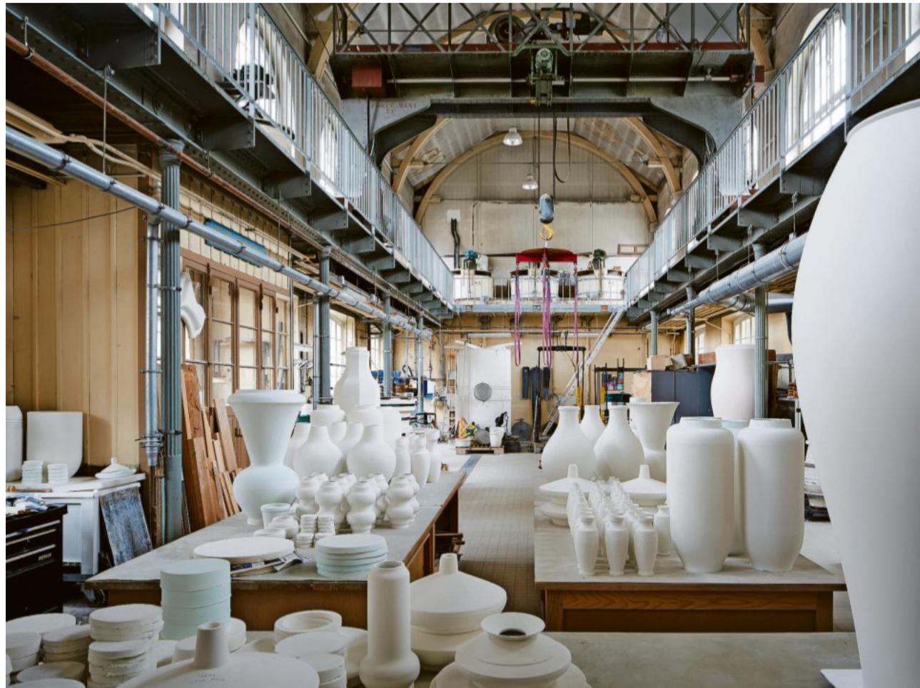
Blick in die Manufaktur (oben); die legendäre „Busenschale“ (rechts); Porzellankubus von Emmanuel Boos (unten)

Ludwig XV. ließ sich das berühmte, aus 1749 Teilen bestehende Service „Bleu céleste“ in Türkisblau und mit feinst gemaltem Blumendekor anfertigen. Madame de Pompadour, königliche Mätresse und leidenschaftliche Porzellanliebhaberin, setzte sich ganz besonders für die Manufaktur ein; auf ihr Betreiben hin bekam sie 1756 einen neuen Sitz im Westen von Paris: