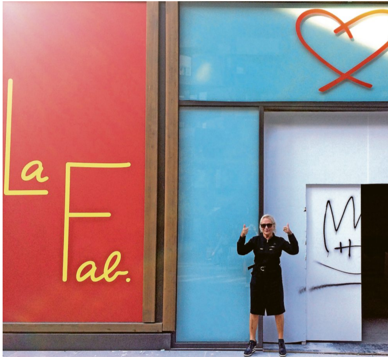
Die Designerin Agnès B. (rechts unten) steht vor „La Fab.“ im 13. Arrondissement in Paris (oben), wo von diesem Herbst an ihre „Galerie du Jour“ und ihre Stiftung beheimatet sein werden. Das Selbstporträt von Jean-Michel Basquiat (rechts oben) hat sie schon im Jahr 1984 erworben.

Im Herbst eröffnet die Modeschöpferin und Kunstsammlerin Agnès B. „La Fab“ in Paris: Es ist ein Ort für ihre eigene Galerie, für Ausstellungen und für ihre Stiftung.