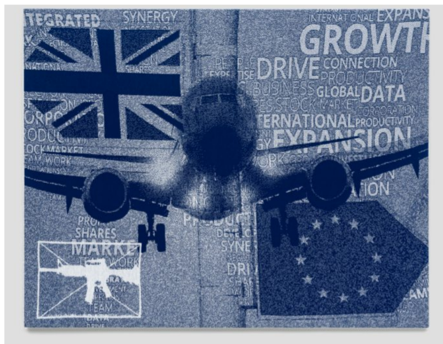
Tobias Donat: „Expansion & Growth“, 2019

Die Messe ist die vierte Ausgründung der „Positions Art Fair“, die in Berlin startete und mittlerweile auch in Basel und München veranstaltet wird. Anders als die klassischen Kunstmesse orientieren sich die Frankfurter am „Salonkonzept“, was bedeutet, dass die Aussteller ihre Werke